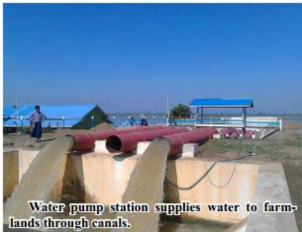
Water pump station supplies water to farmlands through canals.

Mandalay April 20 Mandalay Region Department of Irrigation and Water Utilization Manage-