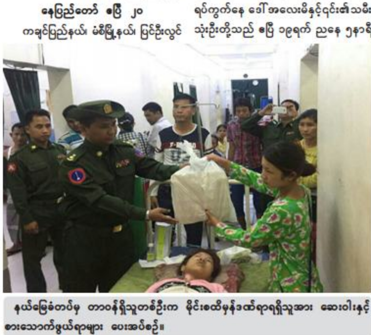
နယ်မြေခံတပ်မှ တာဝန်ရှိသူတစ်ဦးက မိုင်းစထိမှန်ဒဏ်ရာရရှိသူအား ဆေးဝါးနှင့် စားသောက်ဖွယ်ရာများ ပေးအပ်စဉ်။

နေပြည်တော် ၈ နှစ် ၂၀ ကချင်ပြည်နယ်၊ မံစိမြို့နယ်၊ ပြင်ဦးလွင် သုံးဦးတို့သည် ၈ နှစ် ၁၉ ရက် ညနေ ၅ နာရီ ၅ မိနစ်ခန့်တွင် မံစိမြို့၏ အရှေ့မြောက်ဘက် မီတာ ၂၀၀၀ ခန့်အကွာ၌ တောင်ယာလုပ် ကိုင်နေစဉ် KIA အကြမ်းဖက်သောင်းကျန်း သူများထောင်ထားသော နင်းမိုင်းတစ်လုံး အား သမီးဖြစ်သူ မထုတောင်မှ နင်းမိပေါက် ကွဲသဖြင့် မိုင်းစထိမှန်ဒဏ်ရာများရရှိခဲ့ပြီး မထုတောင်(ဘ) ဦးဘရန်နန်မှာ နေရာတွင် ပင် သေဆုံးခဲ့ကာ မကိုးပန်နှင့်မကွာဆိုင်းပန် တို့တွင်လည်း မိုင်းစထိမှန်ဒဏ်ရာများရရှိခဲ့ သည်။ အဆိုပါမိုင်းထိလူနာများအား ဗန်းမော် ပြည်သူ့ဆေးရုံသို့ တက်ရောက်ဆေးကုသမှု ခံယူစေလျက်ရှိပြီး နယ်မြေခံတပ်မှ တပ်မတော်သားများက သွားရောက်ကြည့်ရှု အားပေးစကားပြောကြားကာ ဆေးဝါးနှင့် စားသောက်ဖွယ်ရာများပေးအပ်ခဲ့ကြောင်း သတင်းရရှိသည်။