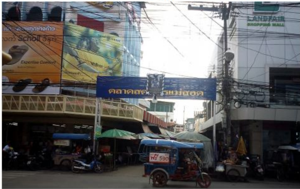
မဲဆောက်ဈေးကြီးကို တွေ့ရစဉ်။

မဲဆောက်မြို့နား နီးလာတာနဲ့အမျှ မြင်ကွင်းတွေက ပြောင်းသွားပါပြီ။ တိုက်တာအဆောက်အအုံ မြင့်မြင့်တွေနဲ့ လမ်းခွေး၊ လမ်းကြား၊ လမ်းသွယ်တွေကို နေရာတိုင်းမှာ တွေ့နေရတယ်။ ကားကတော့ လမ်းမကြီးအတိုင်း ဘယ်ကိုမှမချိုးမကွေ့ဘဲ မောင်းလာပြီး တစ်နေရာရောက်မှ ခပ်ကျယ်ကျယ်လမ်းတစ်ခုထဲကို ကွေ့ဝင်ခဲ့တယ်။ လမ်းထဲမှာကားတွေ၊ ဆိုင်ကယ်တွေ၊