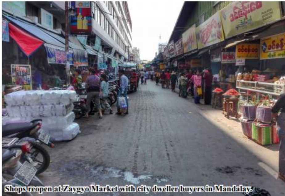
Shops reopen at Zaygyo Market with city dweller buyers in Mandalay.

Mandalay April 20 Zaygyo Market and Mann Myanmar Plaza in Mandalay which were closed for long days during the Maha Thingyan festival period are now operated as usual starting from 20 April,