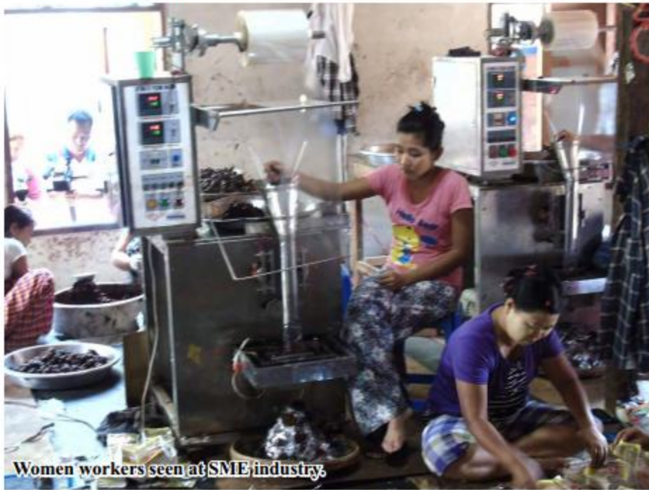
Women workers seen at SME industry.

JICA Project for supporting drawing of policies for development tasks and for creating linkages between industries and experts," she added.