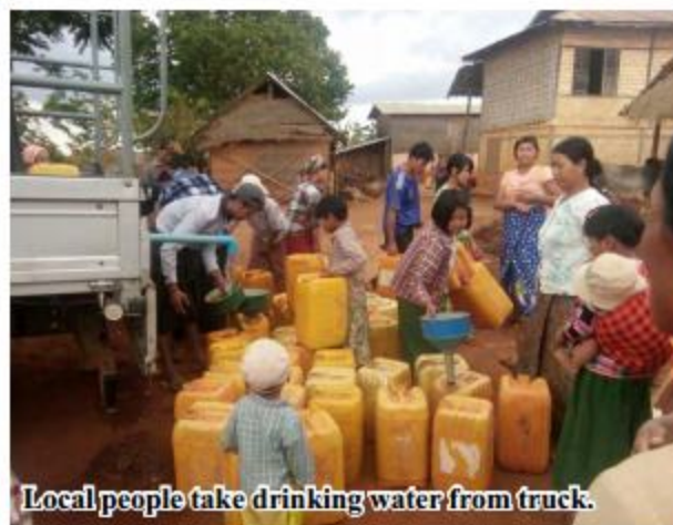
Local people take drinking water from truck.

A total of 10,250 people from 14 villages in Kalaw and Pindaya townships need drinking water. So, Southern Shan State Civil Society