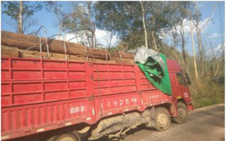
သိမ်းဆည်းရမိ ယာဉ်နှင့် တရားမဝင်သစ်များကို တွေ့ရစဉ်။

နေပြည်တော် ၈ နှစ် ၂၀ ရှမ်းပြည်နယ်(တောင်ပိုင်း)ကွန်ဟိန်း မြို့နယ်အတွင်း တပ်မတော်သားများမြန်မာ နိုင်ငံရဲတပ်ဖွဲ့ဝင်များနှင့် သစ်တောဦးစီးဌာန မှ တာဝန်ရှိသူများပါဝင်သော ပူးပေါင်းအဖွဲ့ သည် နယ်မြေလုံခြုံရေးဆောင်ရွက်စဉ် ယနေ့ နံနက် ၇ နာရီ ၁၅ မိနစ်ခန့်တွင် ဆိုင်းမွန် ကျေးရွာ၏ အနောက်ဘက် လေးပိုင်ခန့် အကွာသို့အရောက်၌ ရပ်တန့်ထားသော နှစ်ဆန်းအမျိုးအစား ၁၂ တီးယာဉ်အမှတ်၊ ၇၂/----- နှင့်ယာဉ်ပေါ်တွင်တင်ဆောင်ထား သော တရားမဝင် ပိတောက်စက္ကဝါး (ခန့်မှန်း ၁၆ တန်ခန့်)အား ပိုင်ရှင်မဲ့သိမ်းဆည်း ရမိခဲ့သည်။ အဆိုပါသိမ်းဆည်းရမိယာဉ်နှင့်တရား မဝင်သစ်များအား မိုင်းနောင်မြို့ သစ်တော ဦးစီးဌာနနှင့် မိုင်းနောင်နယ်မြေရဲစခန်းသို့ စနစ်တကျ လွှဲပြောင်းအပ်နှံသွားမည်ဖြစ် ကြောင်း သတင်းရရှိသည်။ ➤ ➤ ➤