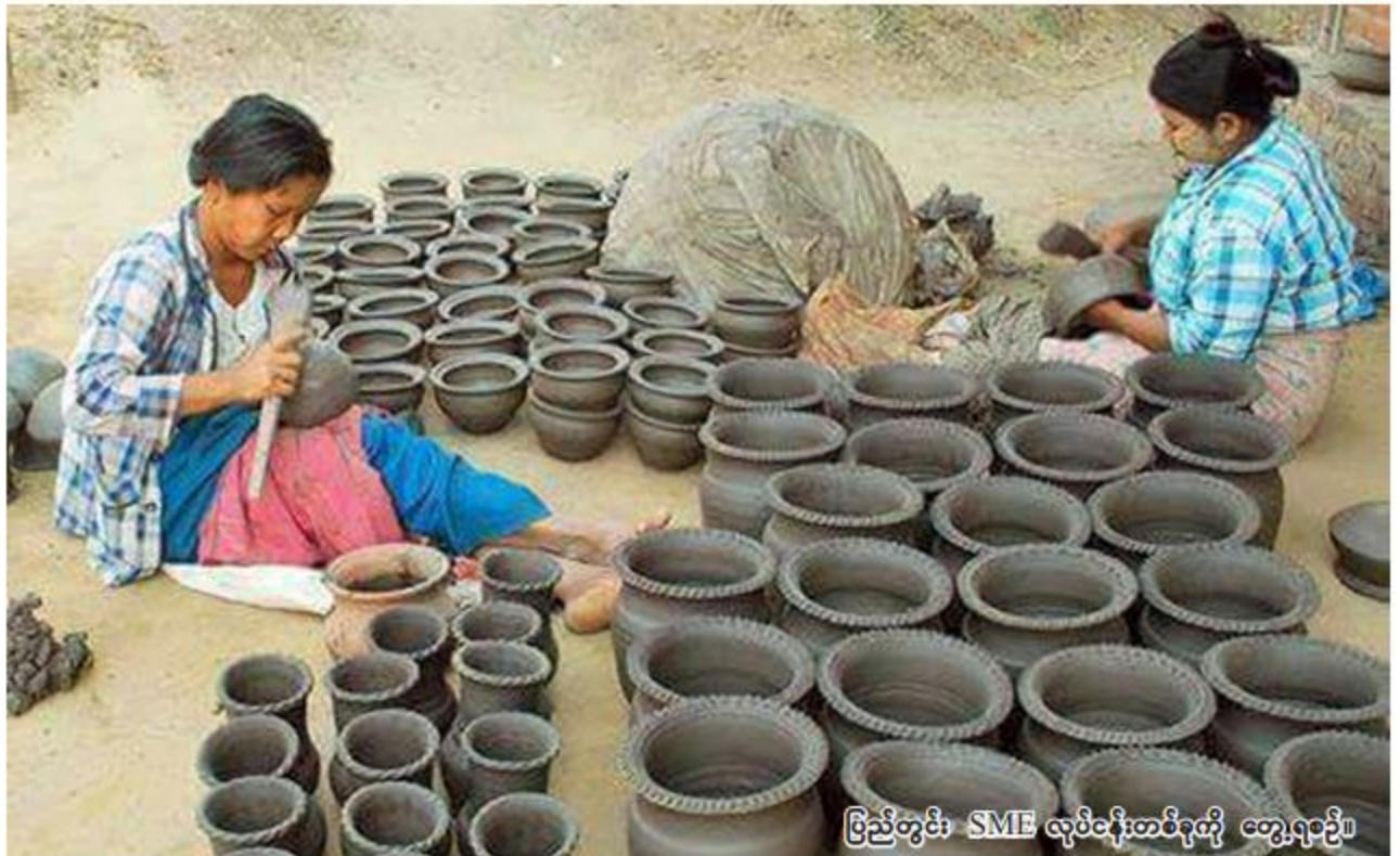
ပြည်တွင်း SME လုပ်ငန်းတစ်ခုကို ကြည့်ရှုရင်း။