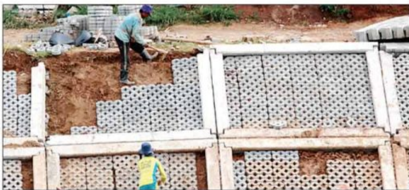
DIHIJAUKAN: Pengerjaan konblok di salah satu ruas Banjir Kanal Timur.