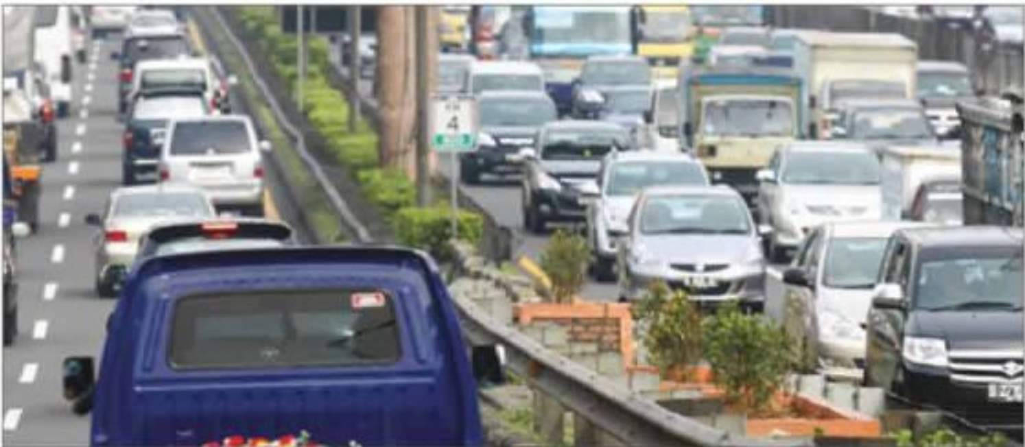
BUTUH SOLUSI: Kemacetan di Jakarta sudah menjadi pemandangan sehari-hari.

tersebut masih dalam bentuk rancangan undang-undang. Dia yakin peraturan tersebut bakal selesai tahun ini. Setelah proses penggodokan selesai lantas bakal dibawa ke DPR untuk segera disahkan. Mengang, lanjutnya, pemerintah pusat sudah menerima usulan dari beberapa daerah yang meminta perluasan wilayah. Kota Cimahi, Jawa Barat, misalnya. "Tapi kita tidak bisa apa-apa, itu kewenangan daerah yang mau memekarkan wilayah," imbuhnya.