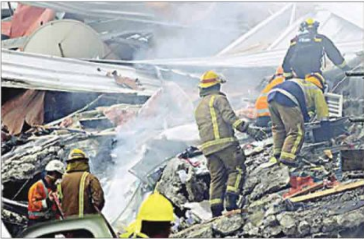
AKIBAT GEMPA: Petugas berusaha menyelamatkan korban yang tertimpa reruntuhan bangunan akibat gempa di salah satu bagian kota Christchurch.

CHRISTCHURCH—Gempa dahsyat berkekuatan 6,3 skala Richter mengguncang kota Christchurch di Selandia Baru, kemarin. Sedikitnya 65 orang diketahui tewas dan diperkirakan jumlah korban jiwa masih akan terus bertambah. Gempa tersebut menghajar pulau selatan Selandia Baru pada pukul 12.51 waktu setempat pada kedalaman 5 kilometer di bawah tanah pada titik 10 kilometer tenggara Christchurch. Gempa dengan titik di daratan ini menimbulkan kerusakan parah di seluruh wilayah kota Christchurch. BBC melansir, dampak gempa kali ini jauh lebih parah dari goyangan lempeng bumi serupa berkekuatan 7,1 skala Richter yang menghantam kawasan tersebut pada September 2010 lalu. Saat itu, gempa berkekuatan 4,9 skala Richter juga menghantam Pulau Christmas. Perdana Menteri Selandia Baru John Key mengatakan, status darurat diterapkan pada kawasan yang terkena gempa. Estimasi kerugian sementara akibat gempa Christchurch diperkirakan mencapai lebih dari USD 3 miliar. Rekaman gambar yang disiarkan televisi dari lokasi gempa menunjukkan beberapa gedung di pusat kota Christchurch roboh. Gedung The pyne Gould Guinness di tengah kota juga mengalami kerusakan dan diperkirakan sedikitnya 30 orang terjebak di dalamnya. Warga kota yang terlihat mencoba bertahan dan menyelamatkan diri di jalanan menunjukkan wajah kegelisahan dan galau di antara