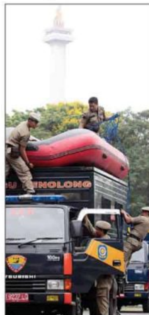
SIAGA: Anggota Satpol PP saat akan berangkat membantu korban merapi.

Lebih Dekat dengan Vita Gamawan Fauzi, Ketua Umum TP PKK Pusat