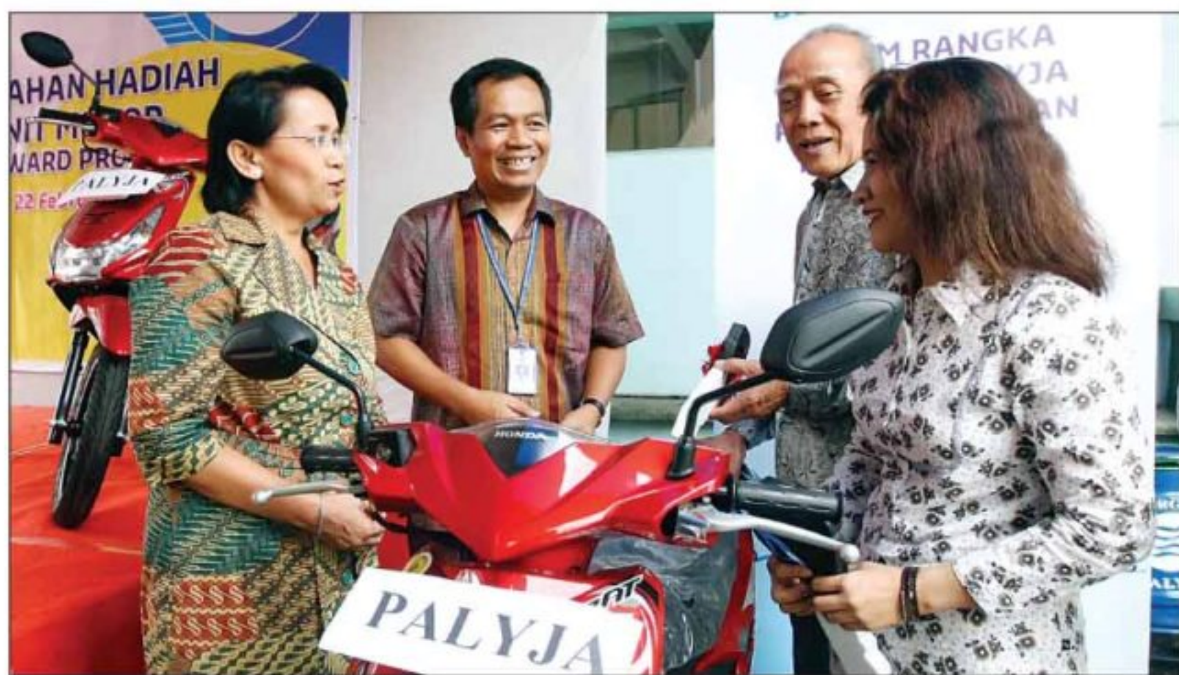
PANCING DISIPLIN: Penyerahan hadiah pelanggan Palyja, kemarin (22/2).

Di lain sisi, salah satu anggota Badan Regulator Pelayanan Air Minum DKI, DR Riant Nugroho yang hadir pada acara tersebut mengatakan, pendekatan PALLYJA dengan memberi hadiah kepada pelanggan patut diacungi jempol. Cara tersebut terbukti bisa memacu kedisiplinan pelanggan untuk lebih membayar tagihan tepat waktu. "PALLYJA menerapkan market approach. Cara ini bisa meningkatkan loyalitas konsumen," ungkap pria yang juga