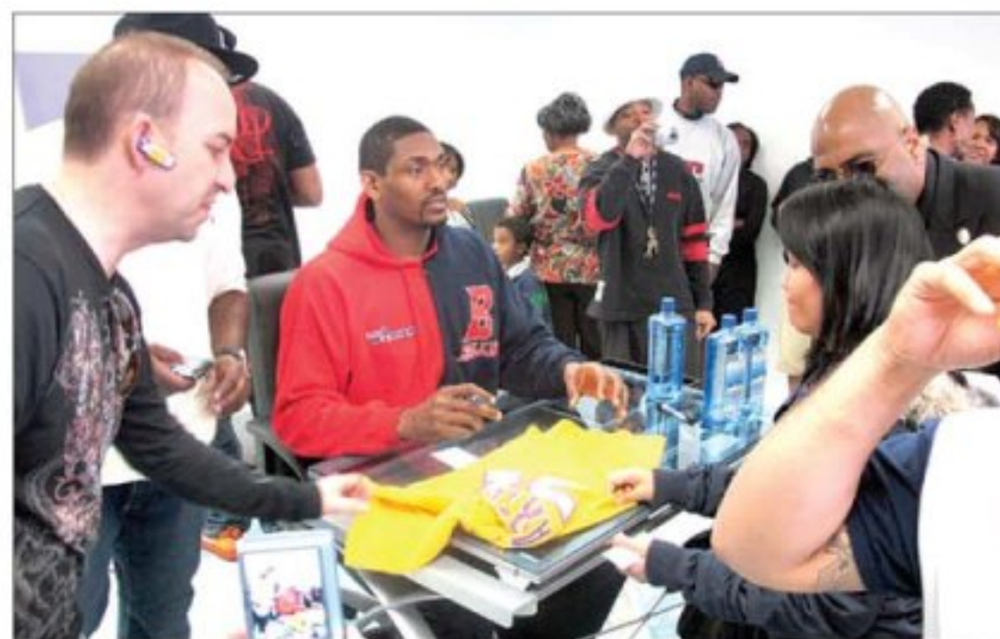
JUMPA FANS: Ron Artest, salah satu bintang Los Angeles Lakers melayani permintaan tanda tangan penggemar di sebuah gerai elektronik di kawasan Sherman Oaks, Los Angeles, Minggu (20/2).