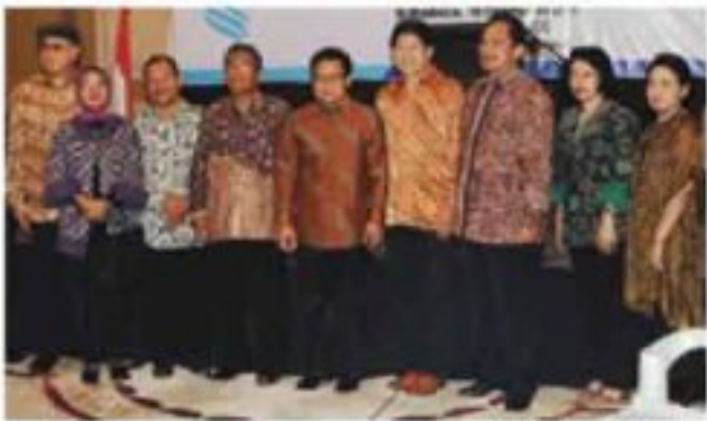
PENGUKUHAN: Menakertrans Muhaimin Iskandar (tengah) menghadiri pengukuhan pengurus DPP IEMSA di Surabaya.