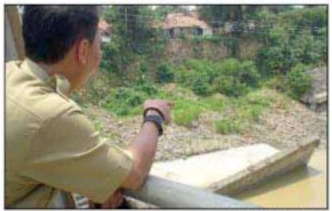
TERGERUS: Pejabat melihat turap yang tergerus air.