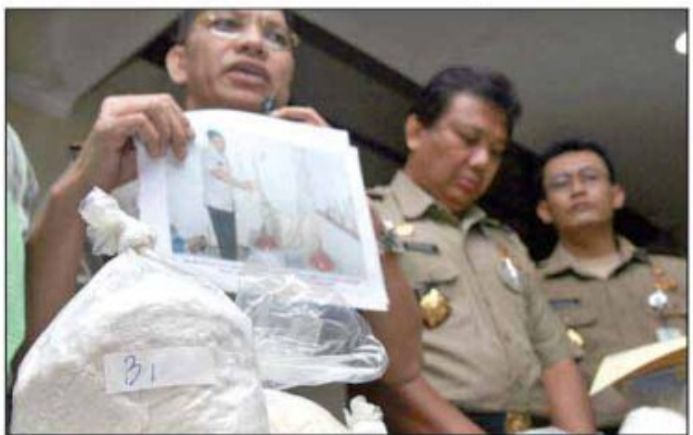
BB: Narkoba jenis SS yang didapat dari home industry yang dibiayai seorang napi.