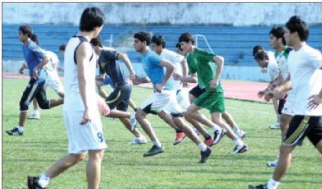
UNGGUL POSTUR: Para pemain timnas U-23 Turkmenistan saat berlatih di Stadion Bumi Sriwijaya, Palembang, pada 21 Februari lalu.

Menang menjadi harga mati yang dipatok pelatih Indonesia A 1 -