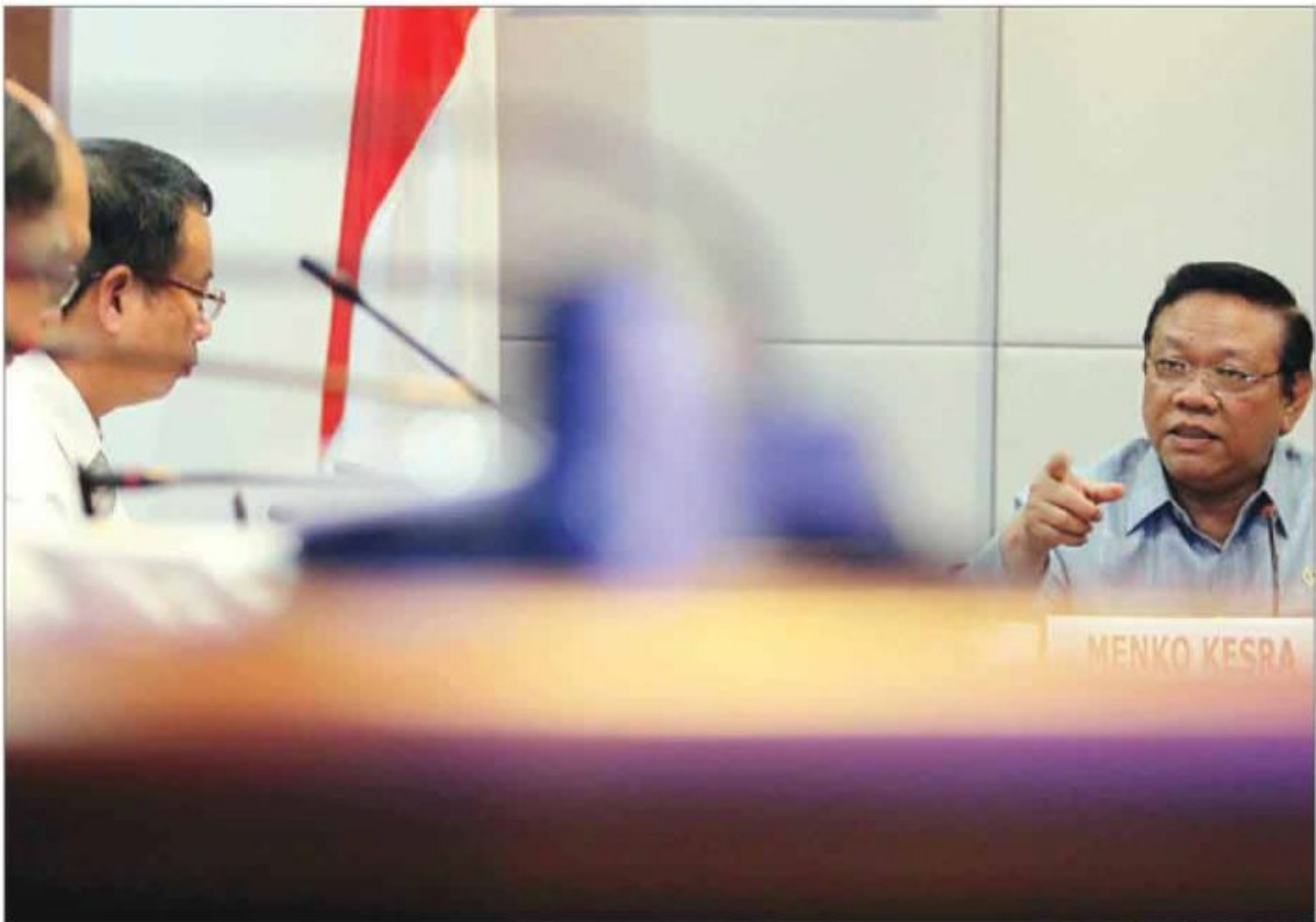
BAHAS SUSU BERBAKTERI : Menteri Koordinator Bidang Kesejahteraan Rakyat Agung Laksono di Jakarta kemarin (22/2).

Terlebih, kasus sulit dibuktikan. Selain itu, masa inkubasi bakteri 5 tahun. Jika ditemukan kasus yang terinfeksi, pemerintah akan men-