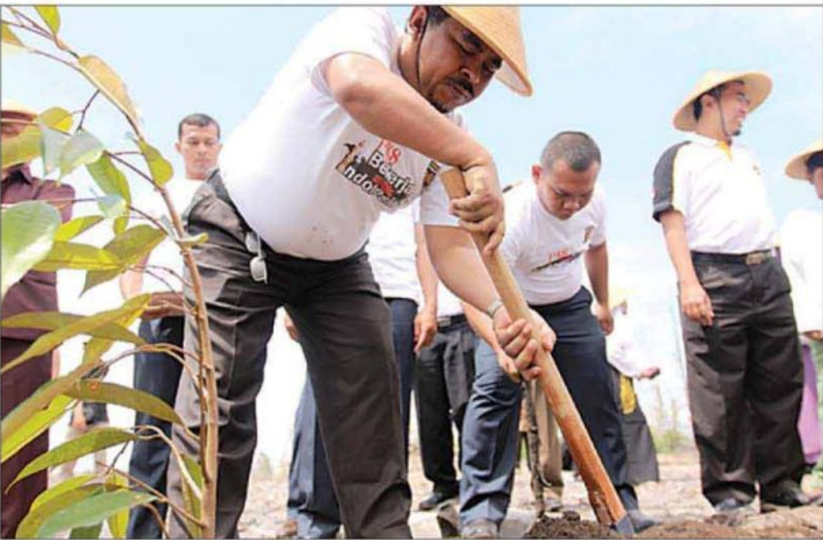
PEDULI LINGKUNGAN: Presiden PKS Luthfi Hasan Ishaaq memimpin langsung penanaman pohon di Selatan Merapi, Sleman, Jogjakarta, kemarin. Kegiatan tanam pohon merupakan rangkaian acara Mukernas PKS yang berlangsung di Jogjakarta.

Disinggung tentang pilihan menanam di lokasi lereng Merapi, Luthfi menjelaskan, pertama, 43 persen dari 6.140 hektar hutan