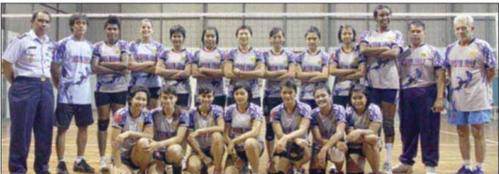
CALON JUARA : Inilah tim putri TNI AU Jakarta yang siap menghadapi putaran pertama seri II yang akan berlangsung di Gresik Jawa Timur.