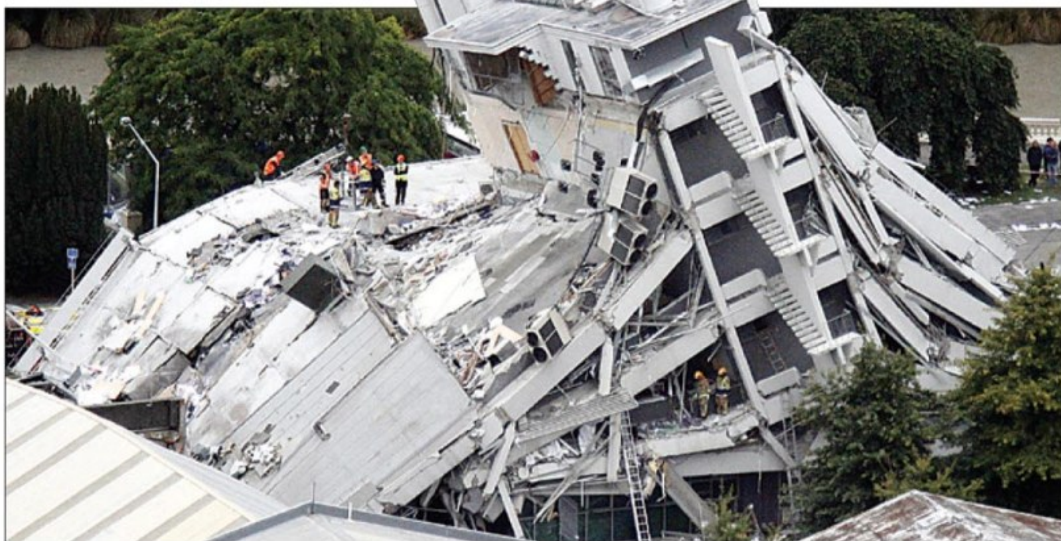
AKIBAT GEMPA: Petugas mencari korban yang tertimbun reruntuhan bangunan Pyne Gould Guinness di pusat kota Christchurch, New Zealand, kemarin.