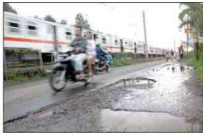
Jalan Rusak Motor melintas di jalan rusak tepatnya di Jalan Raya Citayam menuju Bojong Gede, Kota Depok.

"Yang jelas, jajaran Pemkot Tangerang akan terus melakukan sweeping dan akan bertindak tegas terhadap para pelaku usaha yang mencoba menyalakan atau menjual miras. Karena Kota Tangerang sudah menerapkan peraturan bebas minuman keras," pungkasnya juga. Yang boleh menjual miras hanya tempat tertentu yang memiliki izin talam kecana dan talam seloka. (gin)