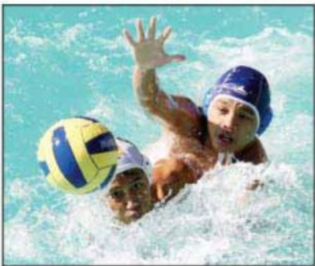
TAMBAH SERU: Kejurnas Polo Air U-19 tahun lalu yang mempertemukan Jambi dan Sumut.

Dalam SEA Games nanti, wushu akan mempertandingkan 20 nomor. Untuk tim inti cabang wushu nantinya diperkirakan berjumlah 28 orang atlet. Vietnam dan Thailand diakui pihak PB WI masih menjadi momok yang harus diwaspadai di SEA Games. (md)