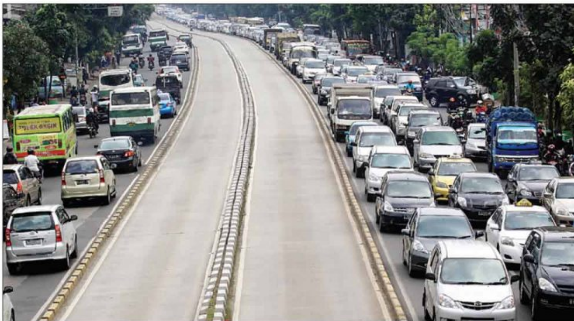
MELOMPONG: Sterilisasi jalur busway dari kendaraan pribadi dan kendaraan umum lainnya terus digenot. Seperti tampak di Jalan Mampang Prapan,