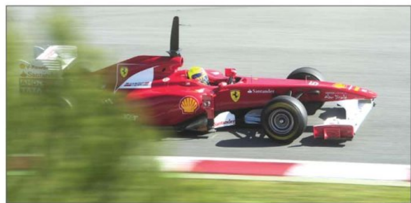
KENCANG: Pembalap Ferrari Felipe Massa saat melintas di trek Sirkuit Montmelo, Barcelona dalam ujicoba (21/2).