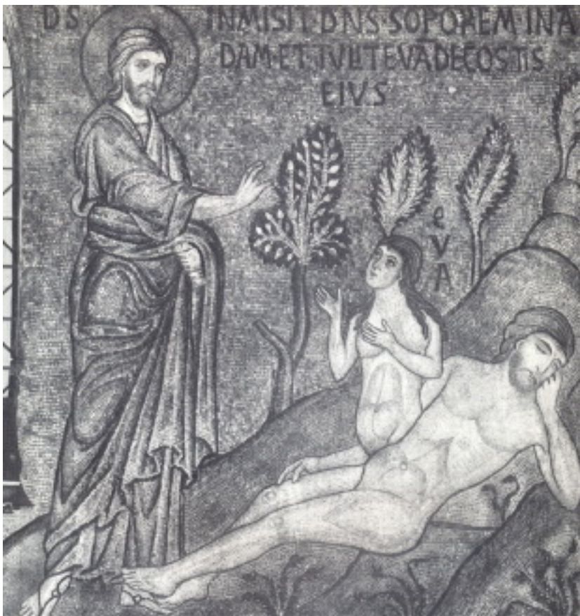
شمایل آفرینش آدم و حوا

خواننده امروزی ممکن است در بعضی از این دلایل نکات دقیق و ظریفی کشف نماید ولی پولس قدیس به خوبی واقف بوده مطالب خود را به چه کسانی خطاب می کند مثلاً وقتی به یونانیان نامه نوشته و می دانسته یونانیان جسم را حقیر می شمارند از موقعیت استفاده کرده و نظریه و عقاید مسیحیت را درباره جسم انسان مطرح ساخته و گفته است: جسم یک فرد مسیحی فقط پوشش ناچیزی نیست که روح در آن زندانی باشد بلکه به این جسم وعده رستخیز و زنده شدن مجدد داده شده است. این جسم عضوی از مسیح و معبد و پرستشگاه روح القدس و بنابراین شایسته بسی تکریم و احترام می باشد.