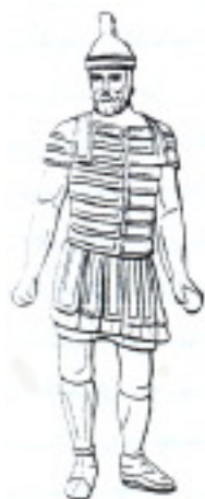
سرباز رومی، ملبس به زره و کلاه آهنی. مجسمه برنزی متعلق به قرن دوم بعد از میلاد (موزه بریتانیا، لندن).

ولی این انتظار همراه با غم و اندوه و افسردگی نیست. نامه به اهالی تسالونیکي رساله ای خشن و خالی از لطف نیست بلکه سرتاسر نشاط و شادمانی است: شادی بین برادران، شادی روح القدس، و بالأخره شادی در برابر خداوند. حتی مرگ نباید مایه غم و اندوه گردد. اکنون که دانستیم این نامه به چه کسانی خطاب شده و این گروه مردان و زنان را شناختیم سعی می کنیم بدانها ملحق شده و به سرچشمه شادمانی آنان برسیم، یعنی خدائی را که انجیل اعلام کرده است بشناسیم.