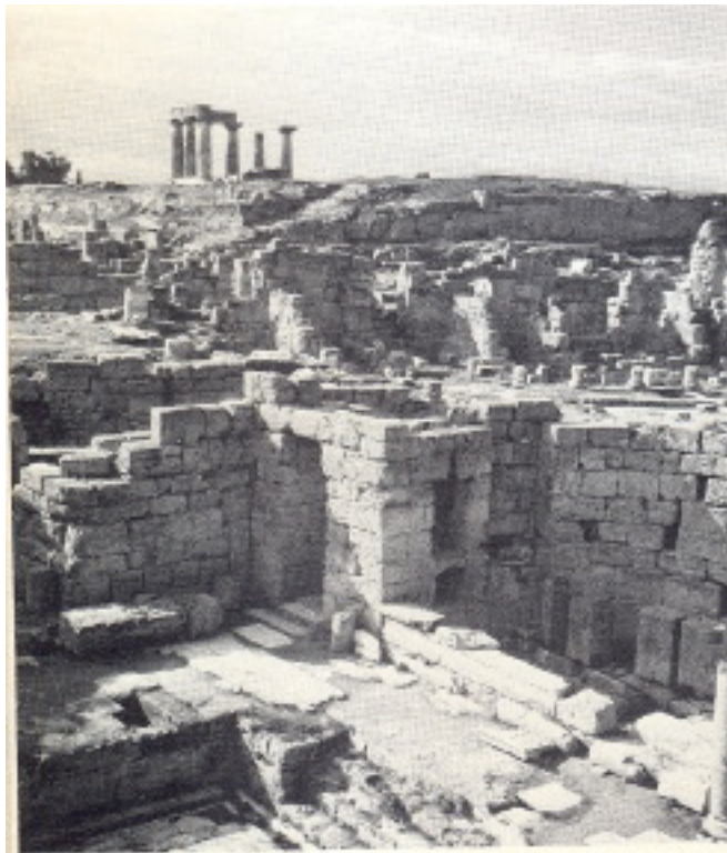
خرابه های شهر قرن‌ت در زمان پولس که باقیمانده های معبد آپولون نیز در آن به چشم می خورد.

ویران شد ولی با موقعیتی که داشت ممکن نبود به همین صورت باقی بماند. لذا در سال ۴۴ قبل از میلاد قیصر روم فرمان داد مجدداً شهری بر روی خرابه های قرن‌تس بنا شود و مردم زیادی از یونان، ایلیری و مقدونیه، که از اروپا آمده بودند، و نیز شرقیان و مصریان و مردان آزادی که در پی شغلی بودند و تعداد زیادی از بردگانی که آزاد شده بودند، به آن سوی رفتند. در میان آنان یهودیانی هم بودند که طبعاً با در دست داشتن قوانین دین یهود در برابر میکرب شرک و الحاد مصونیت داشتند و با رعایت این قوانین خانواده های متحد و کارگاههای