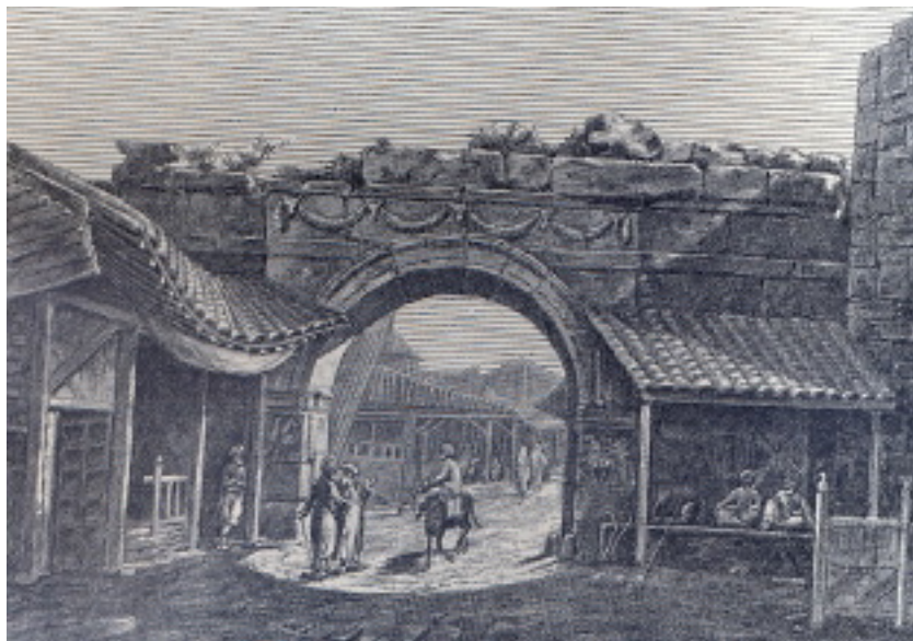
طاق اغوسطوس در مقدونیه، نقاشی کوزینری، ۱۸۳۱