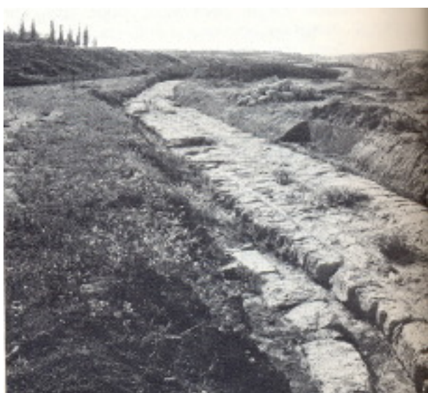
تنگه قرنت محل عبور کشتی ها

مغایرت و مخالفتی نداشت و فقط از زیاده روی و انحراف جلوگیری می کرد. همین قوانین در سرزمین یهود دهقانان سرباز و در شهر قرنتس سرمایه داران پر کار به وجود آورده بود. قرنتس برای یک عضو سنای روم که به عنوان والی انتخاب می شد محل خدمت مناسبی به شمار می رفت زیرا می توانست یک سال استراحت نموده و به تحصیل ثروت پردازد بدون آن که مسئله ای پیچیده یا واقعه غیرمنتظره ای پیش آید. در سال ۵۲ میلادی غالیون، برادر سنکا Se'ne'que فیلسوف مشهور رومی والی ایالت قرنتس بود و در زمان حکمرانی او پولس در دادگاه قرنتس محاکمه شد (اع ۱۸: ۱۲ - ۱۷).