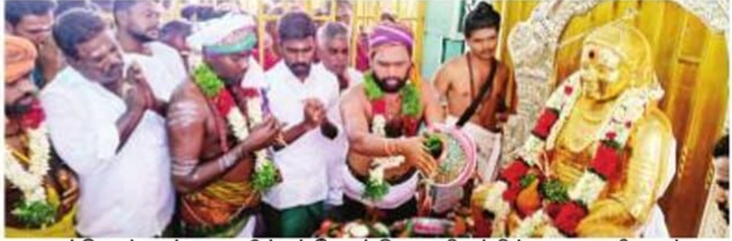
பசம்பொன் முத்துராமலிங்கத் தேவர் நினைவிடத்தில், அவரது சிலைக்கு புனித நீரால் அபிஷேகம் செய்த சிவாச்சாரியர்கள்.

கள் தலைமையில் சிவாச்சாரியர்கள் பூஜைகளை செய்தனர்.