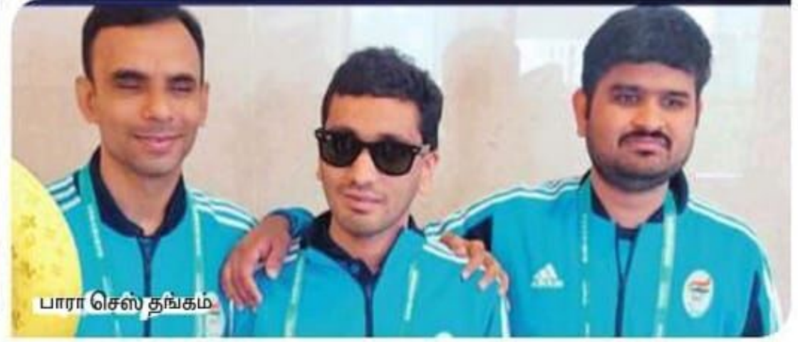
பாரா செஸ் தங்கம்

ஹாங்ஷென், அக். 28: ஹாங்ஷென் ஆசிய பாராலிம்பிக் போட்டியில் இந்திய அணி 29 தங்கத்துடன் மொத்தம் 111 பதக்கங்களை கைப்பற்றி வரலாறு படைத்தது.