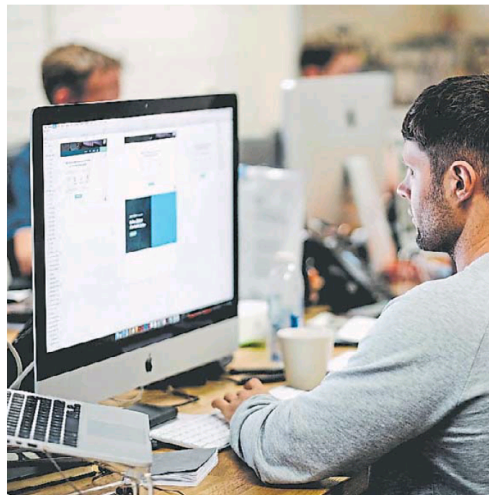
Ayuda. La IA se comporta como un asistente personalizado.

Por lo tanto —al menos por ahora— la IA generativa es una gran aliada para la productividad. Por ejemplo, es muy útil para crear fragmentos de código, configurar un sistema o hacer pruebas unitarias, y así agilizar la tarea del programador. Es decir, en una empresa, la IA se comporta