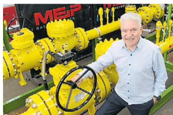
MEIP. Una de las firmas contratadas.