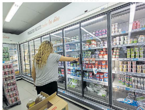
Por la inflación. La gente compra lo que puede y no lo que quiere.