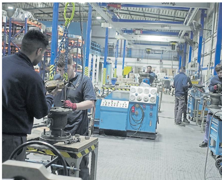
Indave. La planta de Berazategui donde se produjeron las válvulas para los "bypass" del caño principal.