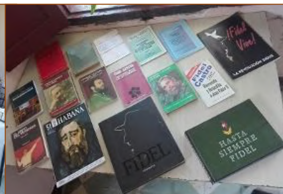
Intercambio sobre la presencia de Fidel en la transformación del Municipio, Sede UNHIC IJ. 13 de agosto de 2021.