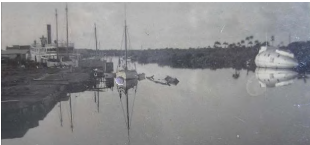
A la derecha, barco "El Intrépido" a punto de ser llevado al desguace final, construido por Víctor Hugo D'Alerta Soto.

Fue su constructor frustrado, aquel pintor al óleo y fotógrafo heredero, Víctor Hugo D'Alerta Soto, quien hiciera un insospechado aporte a la historia de la nación: las excelentes fotos tomadas a Fidel y los moncadistas , al completar sus expedientes en Presidio Modelo.