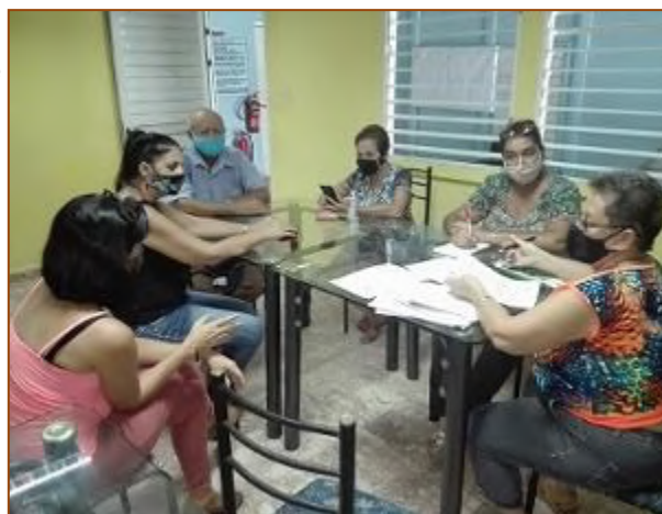
Reunión con Sección de Base “Juan Colina La Rosa” (Telecentro Isla Visión)

En la filial de la UNHIC en la Isla de la Juventud se realizaron varias actividades como fueron: la presentación y venta de libros, intercambio, participación con la UNEAC en las actividades de ce-