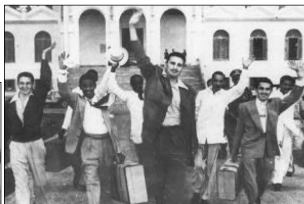
Fotos tomadas por Víctor Hugo D'Alerta Soto, el 15 de mayo de 1955. Saliendo Fidel con sus compañeros moncadistas del Presidio Modelo.