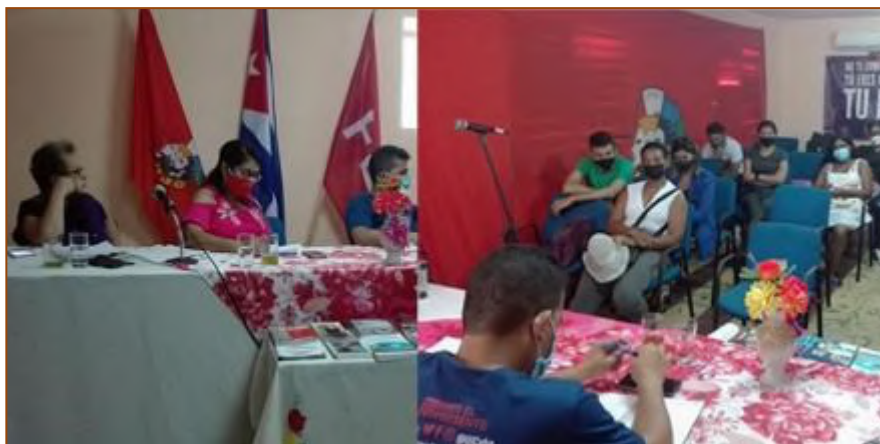
Evento Científico de Jóvenes, efectuado el 20 de julio de 2021, en la sede de la Unión de Jóvenes Comunistas.

lebración por el 60 aniversario, reconociendo su quehacer. Se desarrolló conjuntamente con el ICAP un coloquio sobre el quehacer de la Unión, así como la importancia del conocimiento y divulgación de la Historia Nacional y Local. Se logró realizar el Evento Científico de Jóvenes con el coauspicio de la UJC Municipal y el Departamento de Historia-Marxismo de la Universidad “Jesús