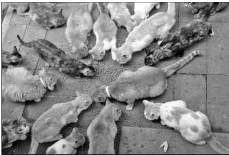
Un cuento con suspense del inolvidable Manucho Mujica Láinez.

Serafín se sintió mal, muy mal, una tarde. Cuando regresó del trabajo, renunció por primera vez, desde que allí vivía, al