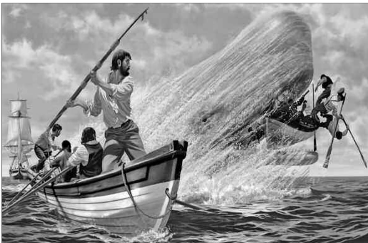
La novela de Melville es un ícono de la literatura del siglo 20 que también sirve para motivar reflexiones.

Esta novela trata de: la caza de ballenas, la vida de los marineros de esa época, la mirada sobre los cetáceos y de la ven-