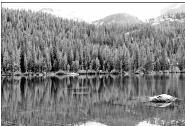
Los arces plateados y otras especies absorbieron CO2 durante más tiempo de lo esperado, según el estudio de la universidad de Bristol.

Algunos de los árboles también fueron sometidos a niveles elevados de ozono, el principal ingrediente del smog, para simular el aire más contaminado del futuro.