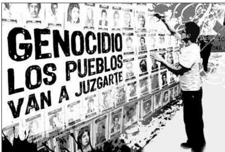
Los crímenes de lesa humanidad atentan contra el proyecto de vida.

Una constante, en la historia de la caracterización de este cuadro, ha sido su aparición asociada a diferentes conflictos bélicos. Alrededor de 1870 se describe lo que dio en llamarse "corazón de soldado" o "corazón irritable". Pocos años después, en 1884, H. Oppenheim describe, en Alemania, un estado que llamó neurosis traumática, en víctimas de acciden-