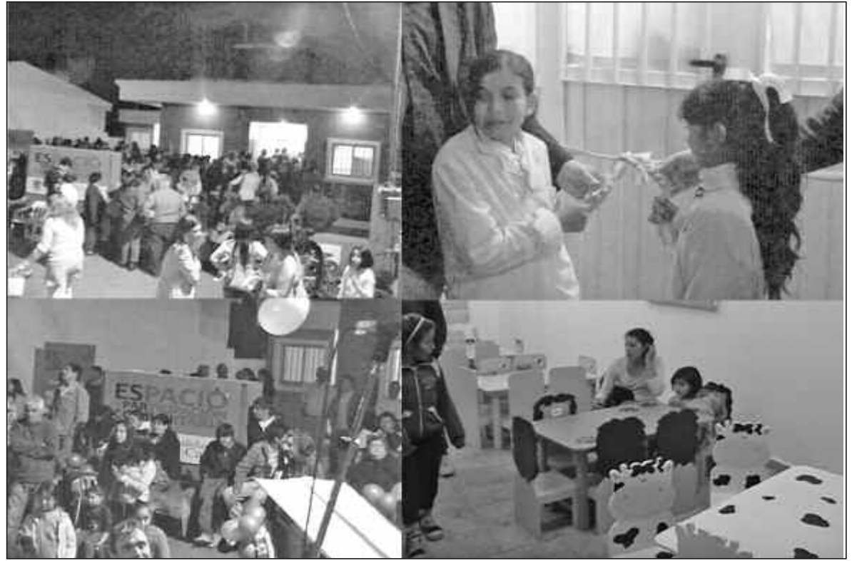
Muchos vecinos participaron de la inauguración en Malabrigo.

Es un edificio que se construyó con fondos provenientes, mayoritariamente, del gobierno nacional a través de la Comisión Nacional de Tierras para el Hábitat Social que depende de la Secretaría General de la Presidencia de la Nación. Allí, la superficie está dividida en dos espacios: por un lado, un salón de usos múltiples con baños y una oficina donde funcionará en el futuro la sede del centro vecinal para que pueda desarrollar allí actividades de todo tipo. El segundo espacio es para que funcione la Guardería Municipal que tiene también baños, oficina, y un espacio generoso. Con estas instalaciones, el municipio deja de alquilar el predio donde hoy tiene el apoyo