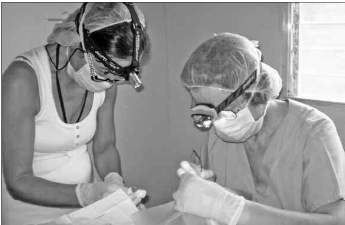
Tratamiento gratuito para cataratas y pterigium ofrecen los m dicos cordobeses de Operaci n Milagro.

Lo importante de destacar es que no hay que abonar ni un peso durante ninguna fase del tratamiento ni para la operaci n en caso de que sea necesario.