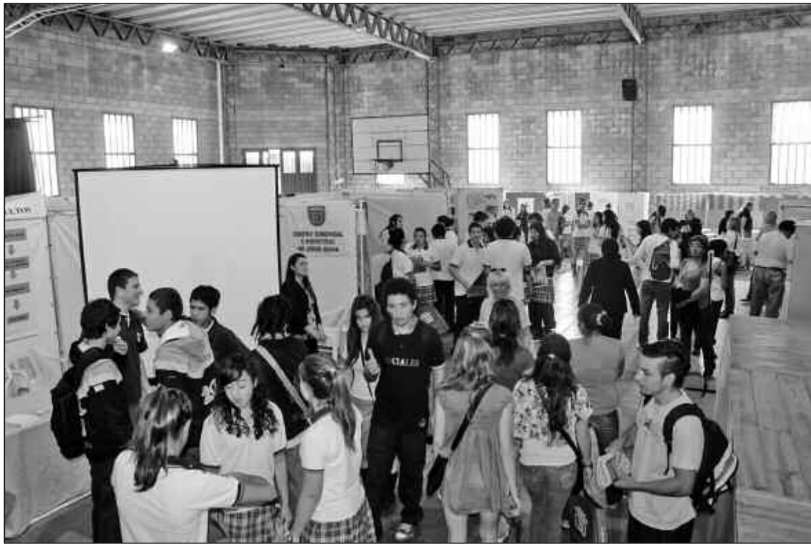
Alumnos de diferentes escuelas secundarias recorrieron la Expo Empleo en el SUM de la escuela Ocampo.