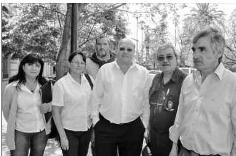
El sindicato de los municipales condenó la precarización laboral.

- El pacto fiscal fue firmado en el año 2000 por cinco años y con una financiación de 30 años de las deudas que tenían los municipios. En ese pacto fiscal, en una de sus adendas, planteaba que aquellos municipios que estaban excedidos en cuanto a personal de planta permanente se abstuvieran de hacer nuevos nombramientos y les fijaba un tope de contratados del 15 por ciento. Acá (por Jesús María) tenemos el 80 por ciento de los recursos humanos con los que cuenta el municipio como contratado. O sea que ninguno de los parámetros de ese pacto fiscal que terminó en 2005 se ha cumplido en Jesús María. No cabe ninguna duda.